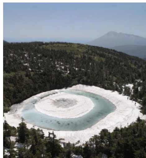
岩手山を望むドラゴンアイ 2020年6月撮影

※「ドラゴンアイ」とは、岩手県と秋田県にまたがる八幡平山頂で雪解けの季節だけに姿を表す龍の目のような美しい沼(鏡沼)のことです。八幡平一の観光スポットである幻の絶景の名前をビールにつけました。(商標登録済み)